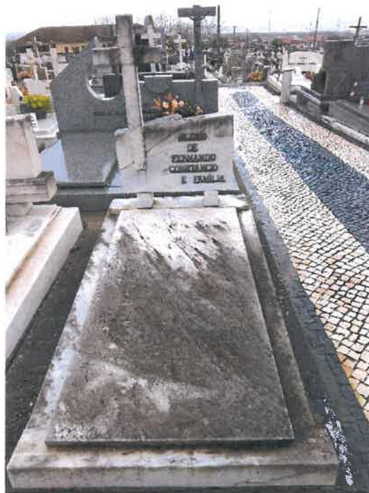
Anexo 6 - Cantão 8 Coval 297