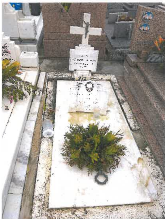
Anexo 5 - Cantão 5 Coval 273