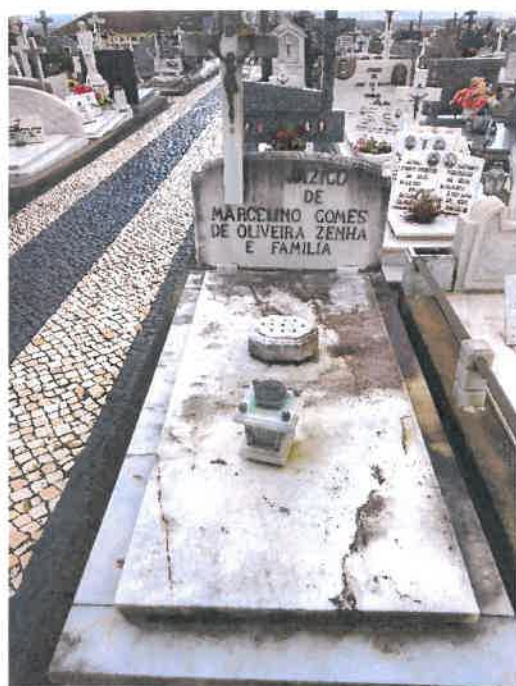
Anexo 4 - Cantão 5 Coval 201