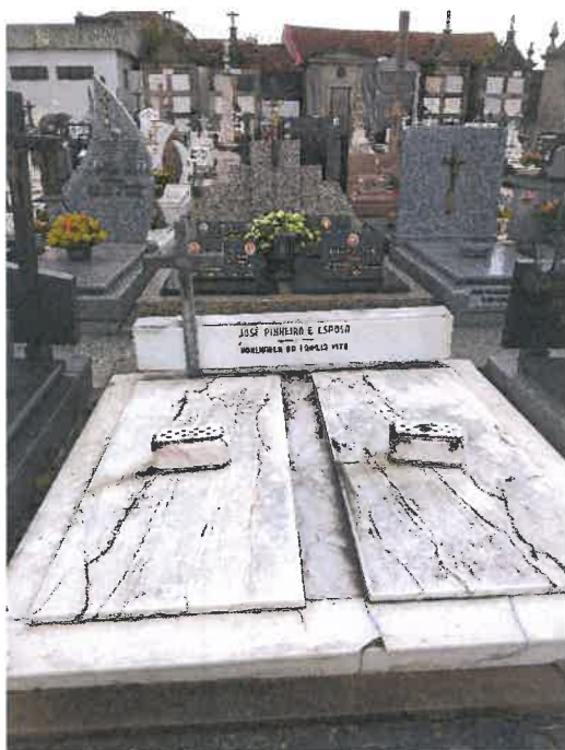
Anexo 3 - Cantão 3 Covais 179 e 180