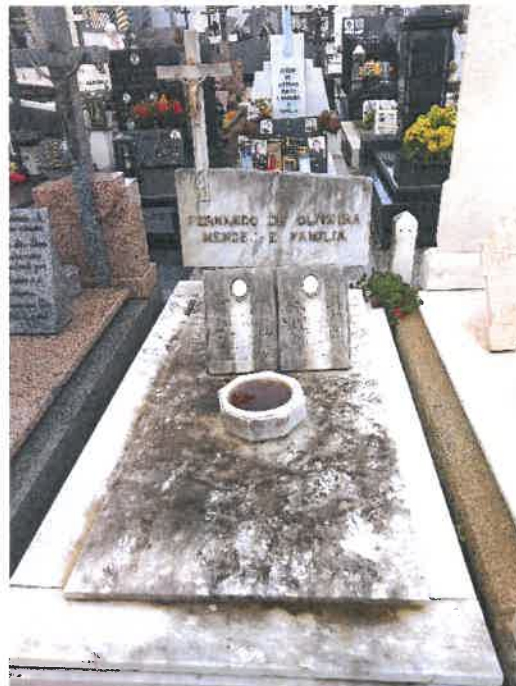
Anexo 2 - Cantão 3 Coval 176