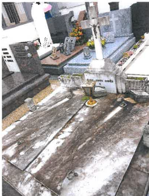
Anexo 1 - Cantão 1 Coval 43